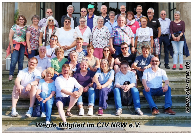
Werde Mitglied im CIV NRW e.V.

Die offizielle Einladung an die Mitglieder erfolgt separat und fristgerecht per E-Mail.